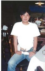
政治家になる決意をした20代